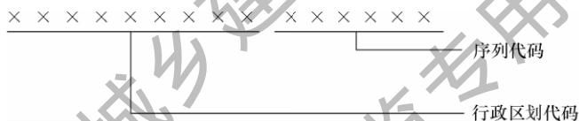
图 4.2.2-1 物业区域代码方法

1 物业区域代码总长度应为 15 位（图 4.2.2-1）。在所属行政区划内根据实际情况和需要，可按行政区划范围内顺序的阿拉伯数字进行编码，其中所属行政区划代码应为 9 位，即前 6 位为县级行政区划代码，后 3 位为街道（乡镇）代码，当无法细到街道（乡镇）时，后 3 位可为 0；序列代码位数应为 6 位，不足位前面补 0。