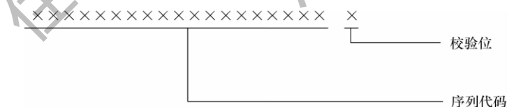
图 4.2.3 账户账号编码方法

4.2.3 账户账号的编码总长度应为 20 位（图 4.2.3）。序列代码为 19 位，用顺序的阿拉伯数据进行编码，不足位前面补 0，最后一位为校验位。