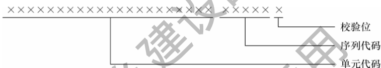
图 4.2.2-4 分户代码方法

4 分户代码总长度应为 26 位（图 4.2.2-4）。单元代码为 20 位，序列代码为 5 位，在单元内根据实际情况和需要，按单元范围内顺序的阿拉伯数字进行编码，不足位前面补 0，最后一位为校验位。