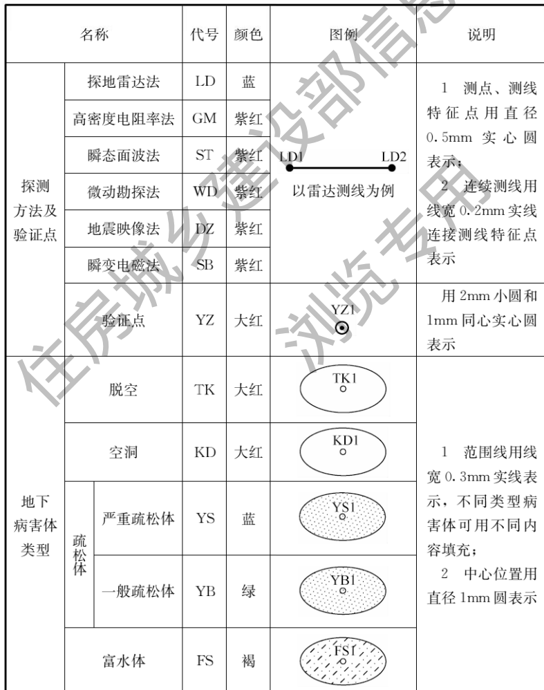
表 H 地下病害体探测成果代号和图例